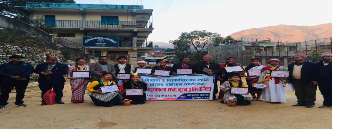
जिल्ला स्तरीय शिक्षक/विद्यार्थी नृत्य प्रतियोगिता सहभागी