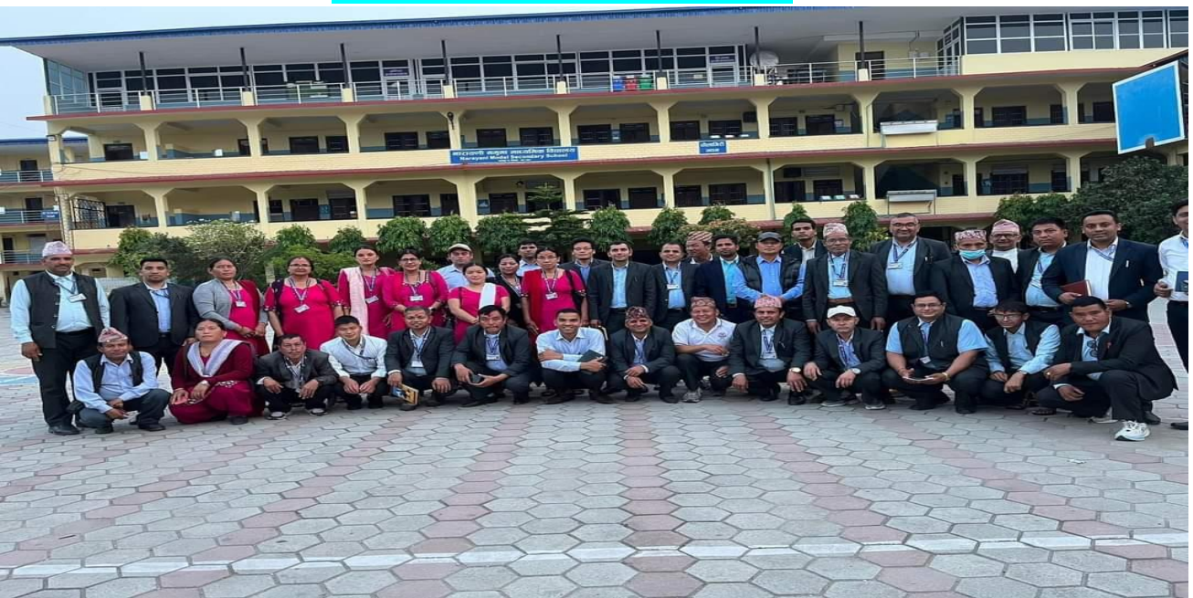
नारायणी नमूना मा. वि. भरतपुरमा लिईएको सामुहिक फोटो