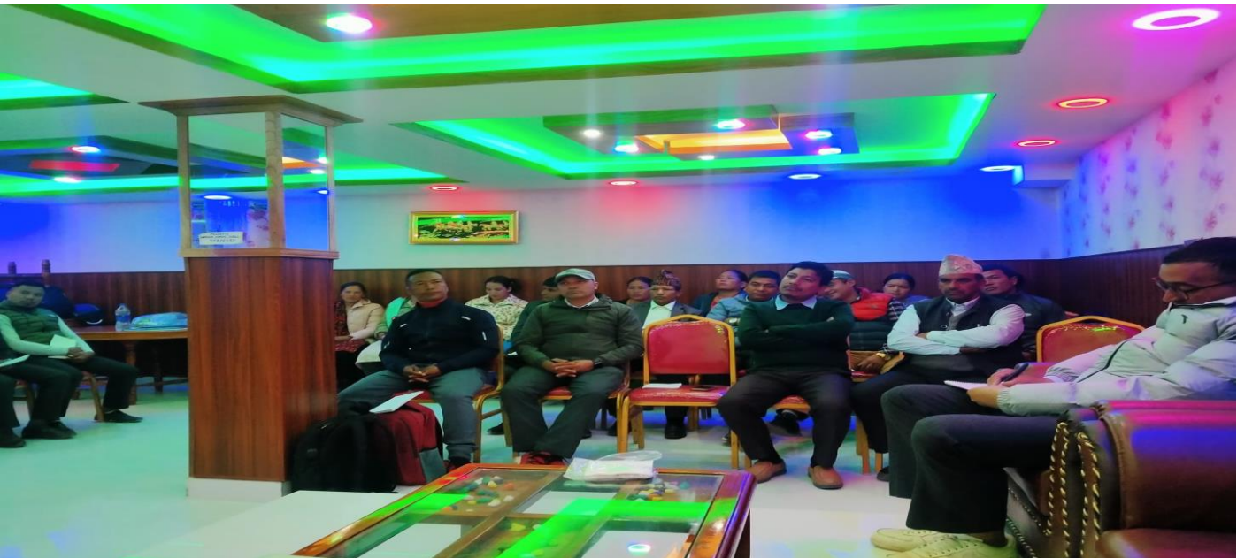
नियमित प्रधानाध्यापक बैठक सहभागी