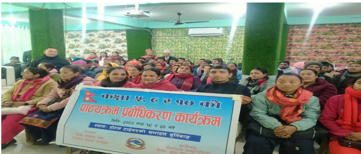
पाठ्यक्रम प्रबोधिकरण तालिम