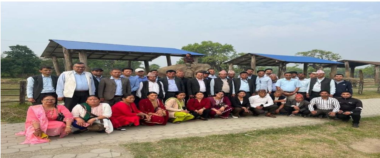
चितवन सौराहा हात्ती प्रजनन केन्द्रमा लिईएको फोटो