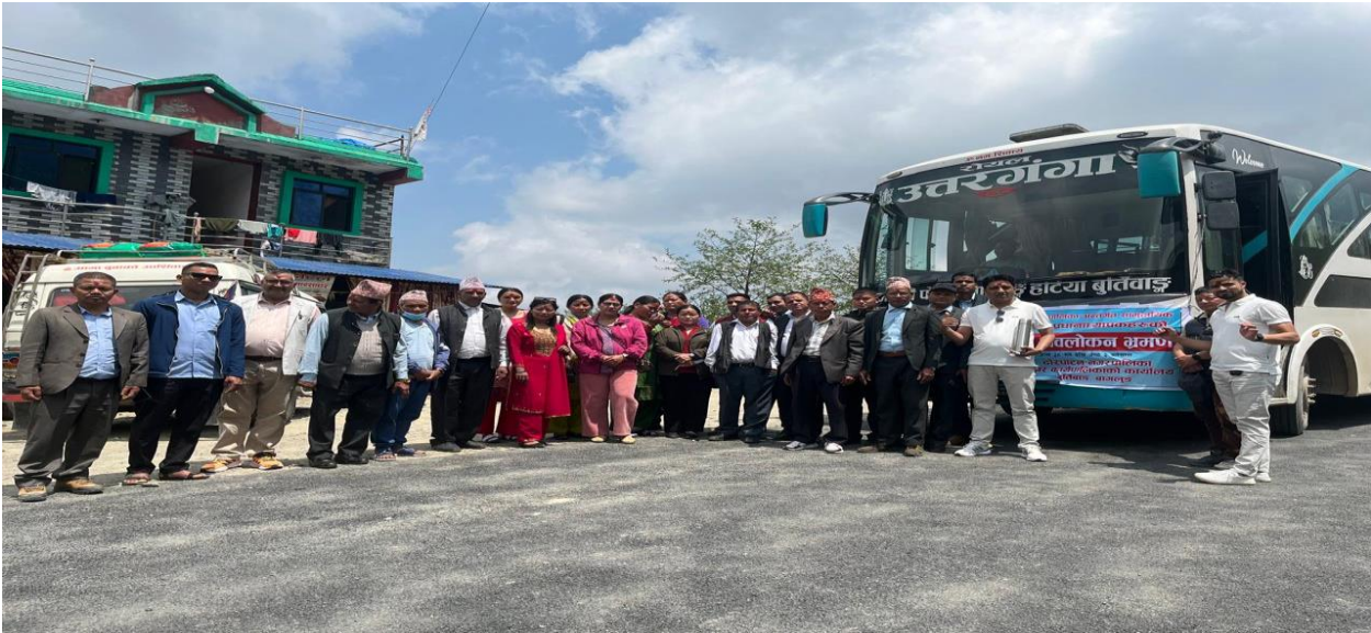
काठेखोला गा.पा. को घोडा बाँधे भ्यू टावरको सामुहिक फोटो