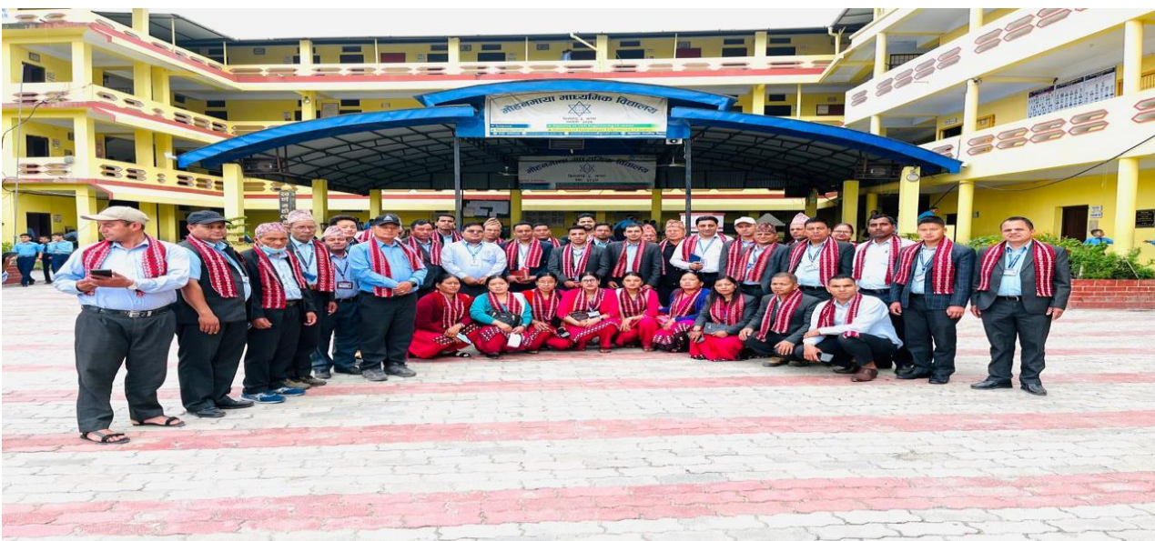
मोहन माया मा. वि. मा लिएको तस्विर