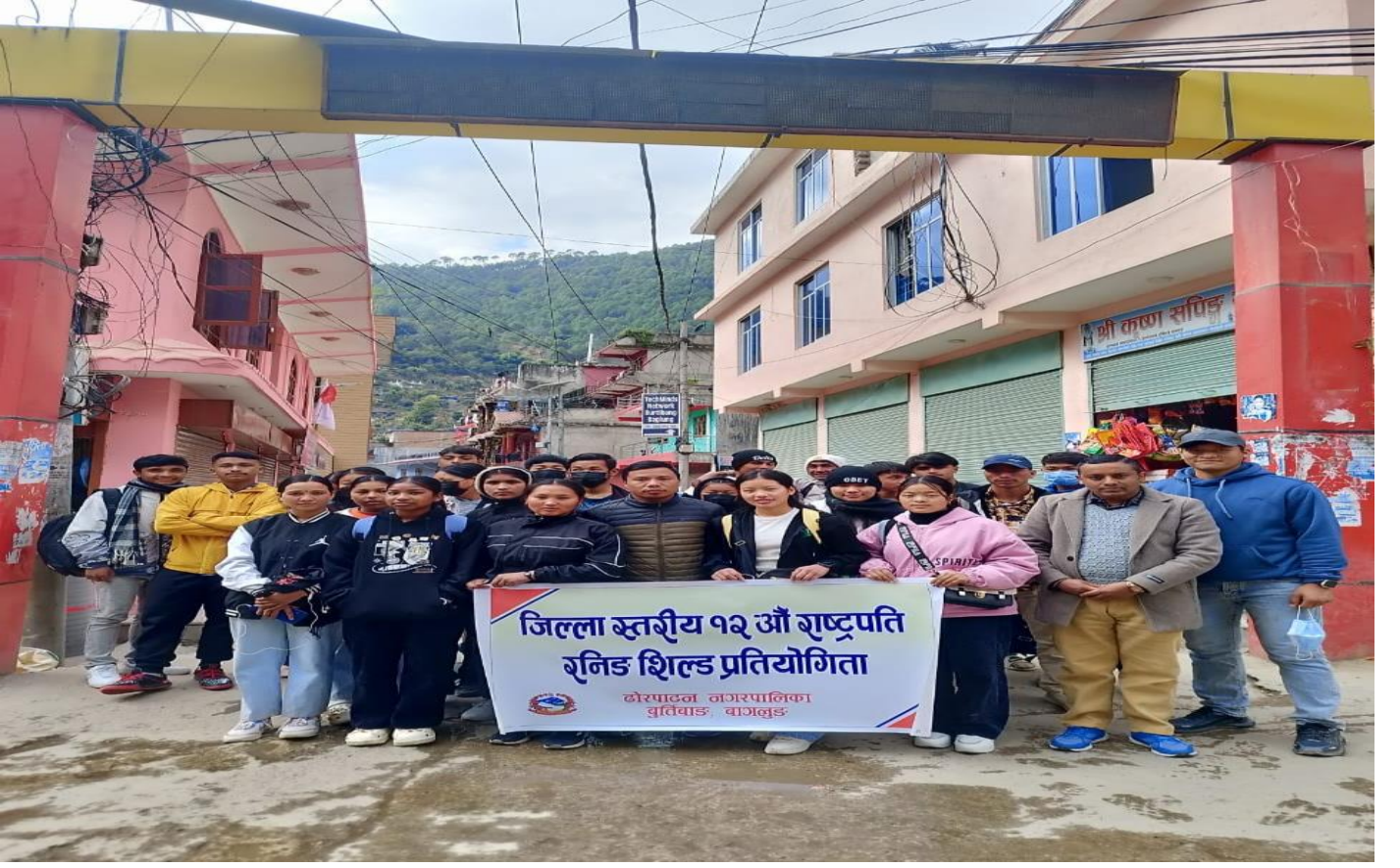
जिल्ला स्तरीय राष्ट्रपति रनिङ्गशिल्ड प्रतियोगिता सहभागी