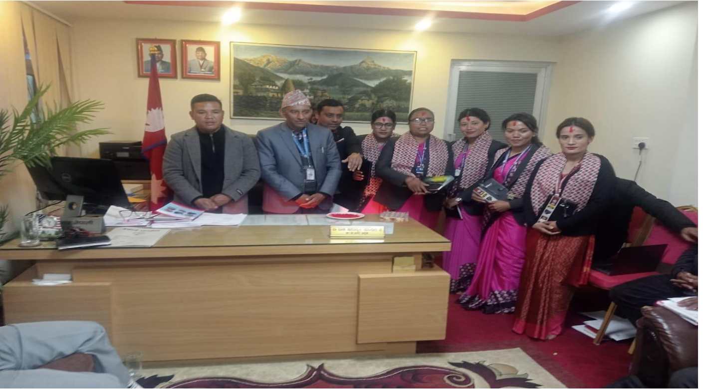
जिल्ला स्तरीय शिक्षक नृत्य प्रतियोगितामा सफल शिक्षक सम्मान कार्यक्रम