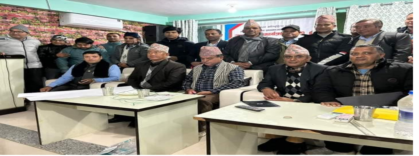
पालिका स्तरीय शैक्षिक अन्तरक्रिया कार्यक्रम