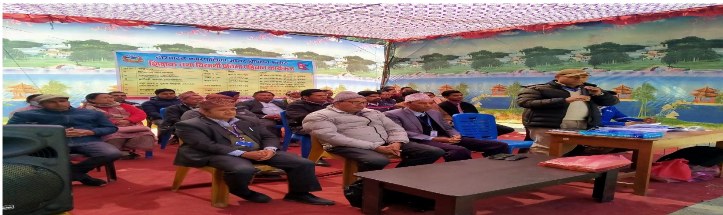
विद्यार्थी प्रतिभा पहिचान कार्यक्रम