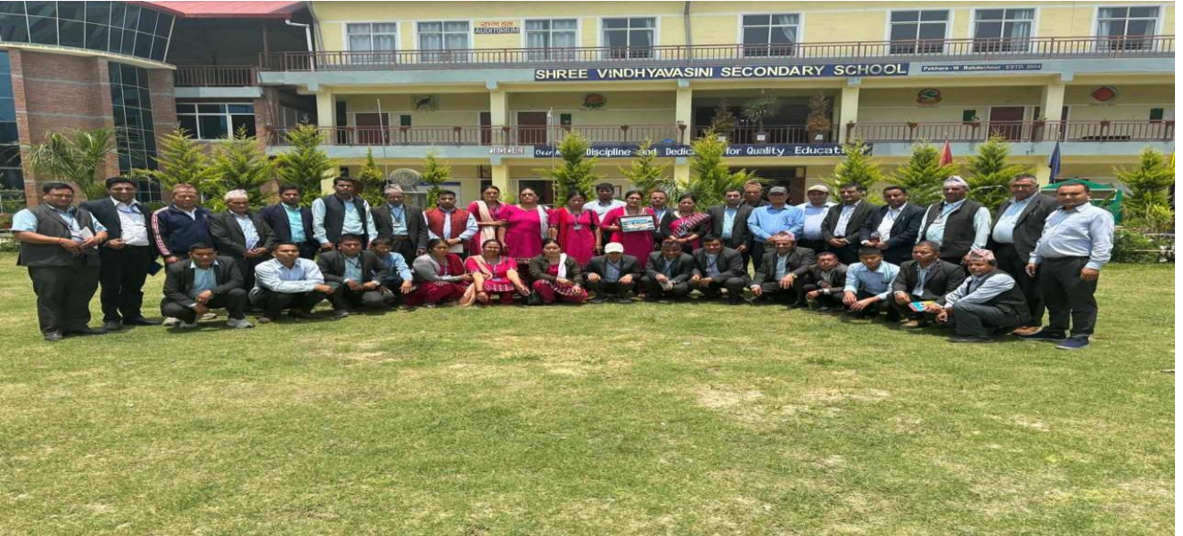
विन्ध्यवासिनीनमूनामा. वि. मा लिईएको सामूहिक तस्विर