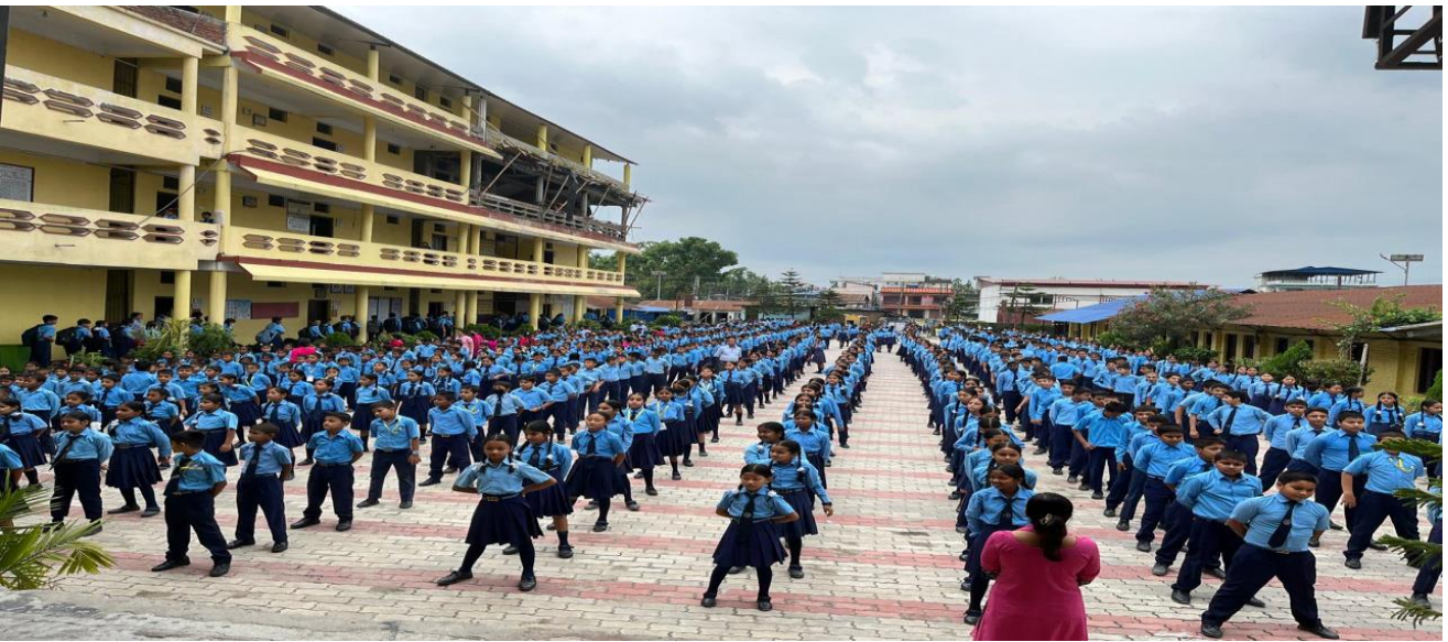
मनमाया मा.वि. मा शारीरिक व्यायमका क्रममा